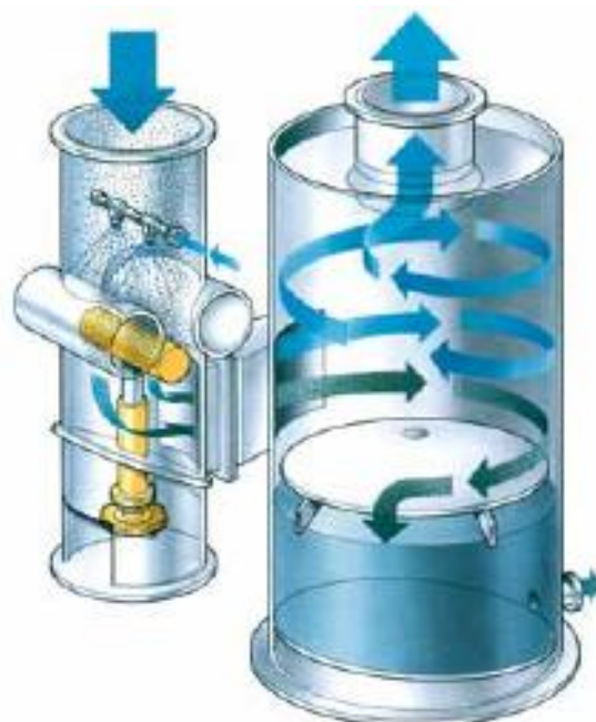
— Schematic representation