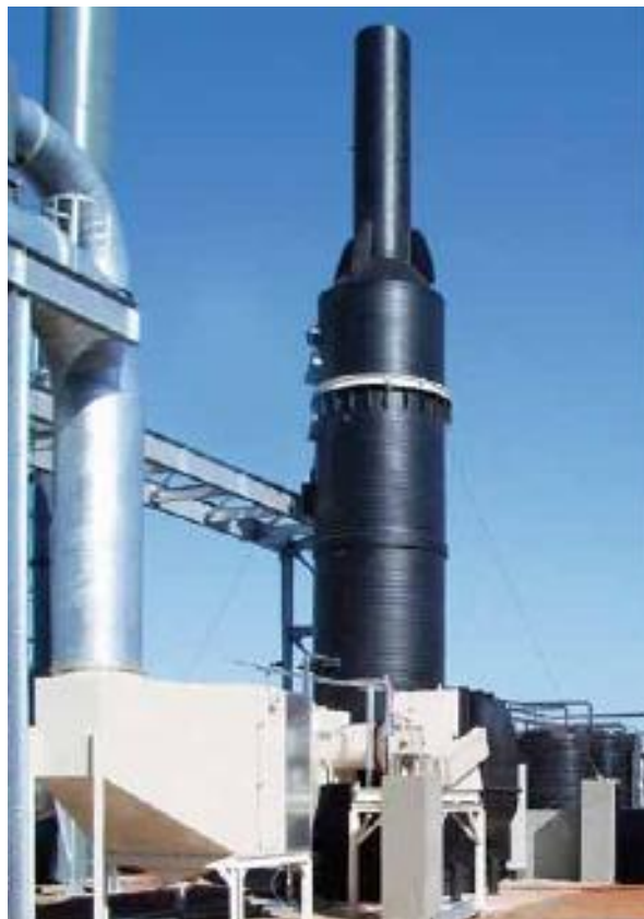
Foundry scrubber for amine KFVG 2000 in South Africa