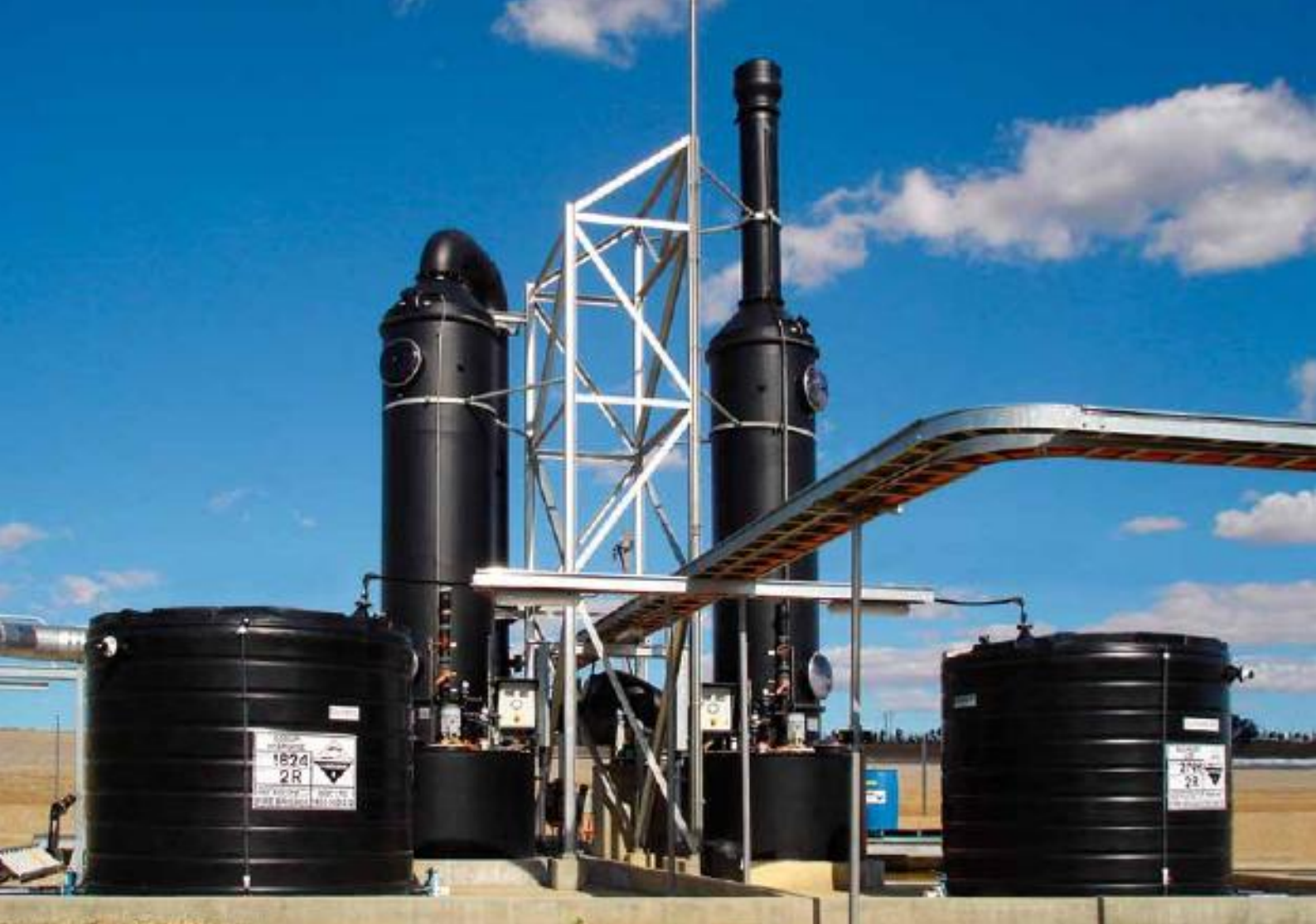
Scrubber plant with fan and chemicals supply tanks located in Australia