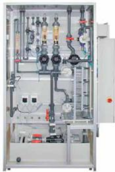
Wet scrubber for semi-epitaxy process