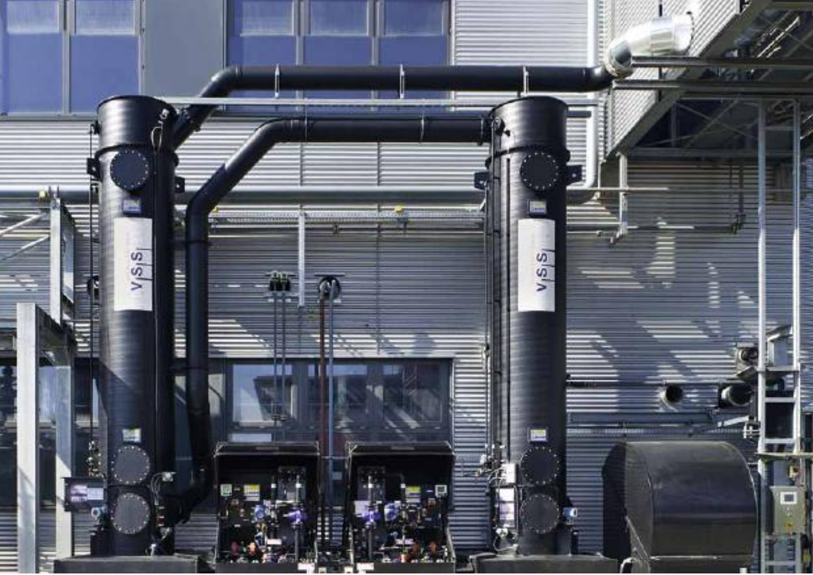
2-stage scrubber for pharmaceutical industry