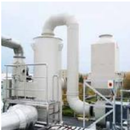
System REITHER scrubber for dust separation in the chemical industry