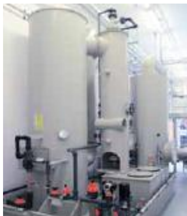
System BAYER-REITHER for \text{SiO}_2 separation in a photovoltaic plant

Venturi scrubbers based on the BAYER-REITHER system are suitable for economically and effectively separating even smaller particles in the range of below 0,1\ \mu\text{m} . This separation is achieved with a hybrid nozzle, developed by the BAYER company. The scrubbing liquid is atomised in it by compressed air, whereby a pulsation of the drop ejection is created through built-in resonance chambers. Hybrid nozzles create with the pulsation a spray cone with rough and very fine drops in a ratio of up to 1:1000. Fine dusts are agglomerated and separated by the fine drops that have formed due to their power of attraction.