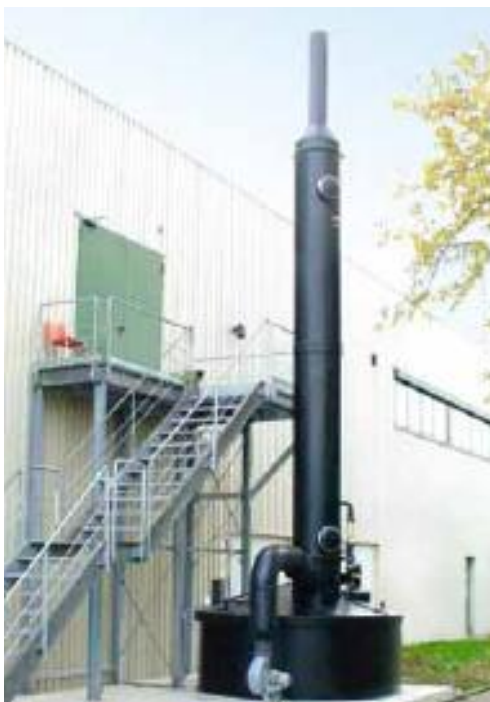
Chlorine emergency scrubber