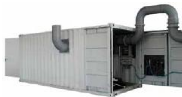
Mobile gas scrubbers for several industrial sectors

VSS has expanded its service. We offer you the possibility to test the exhaust fume reduction for your production facilities with an experimental scrubber. With this service, you have the possibility to test the effectiveness and you offer us the chance to optimally design our product and adapt it to your harmful gas outlet.